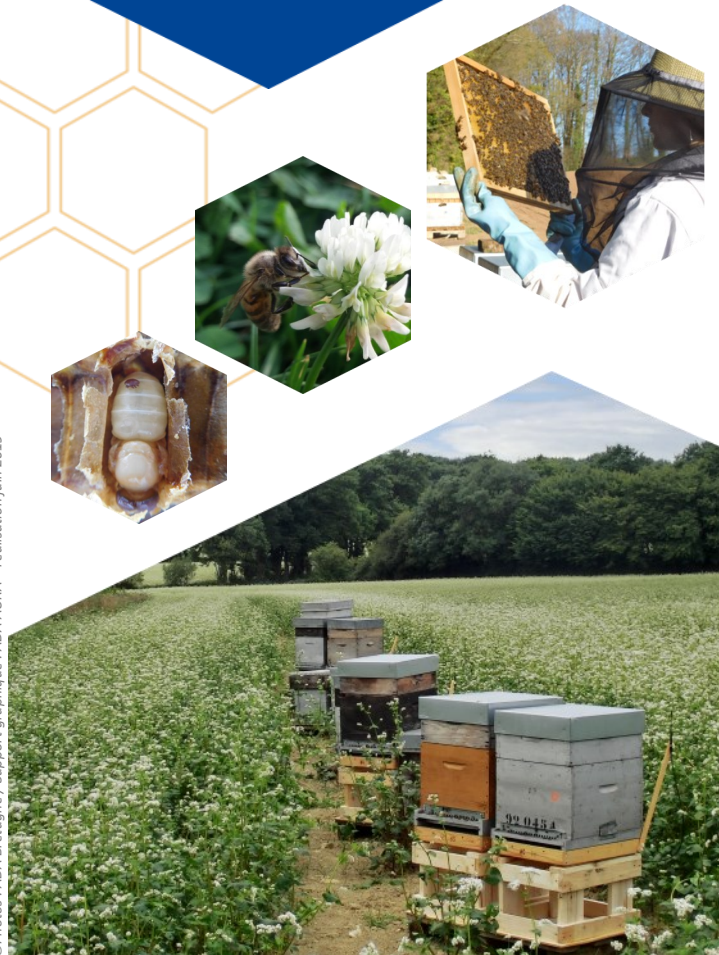
Support graphique : ADA AUKA —réalisation juin 2019